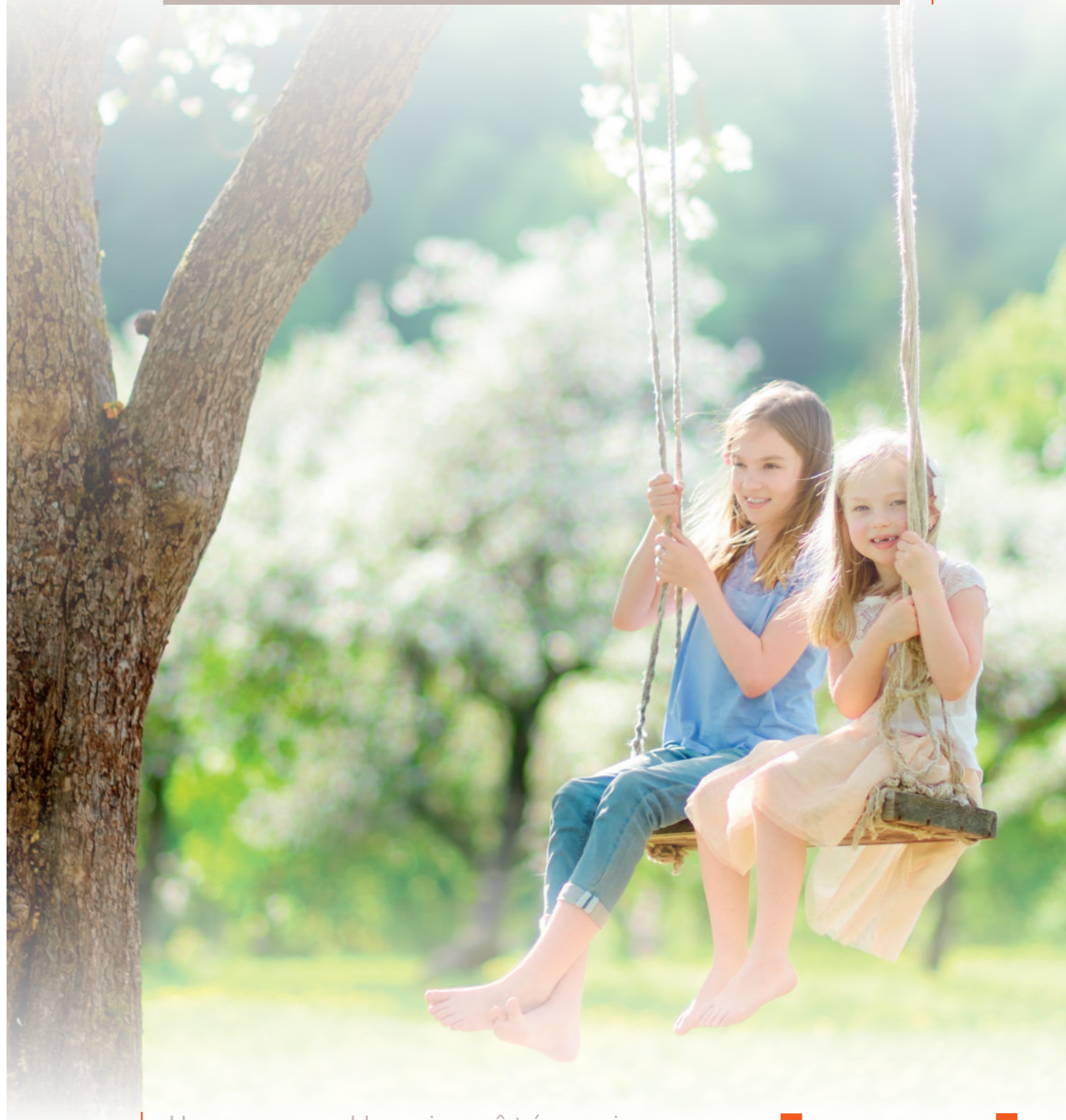
Illustrations non-contractuelles